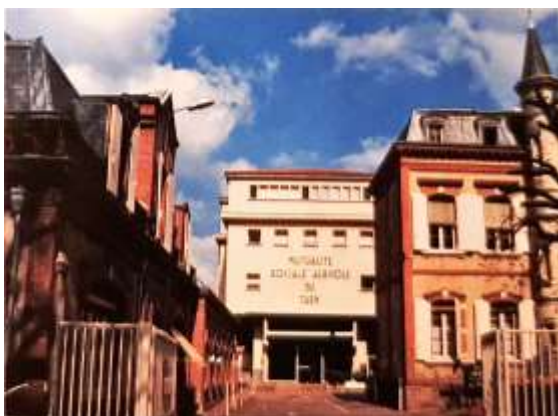
Siège de la MSA du Tarn à Albi