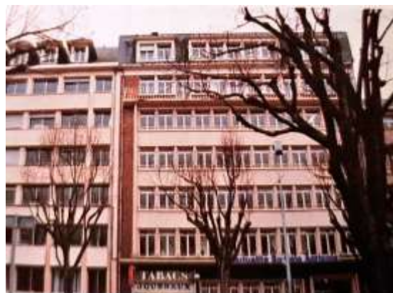
Siège de la MSA de l'Aveyron à Rodez