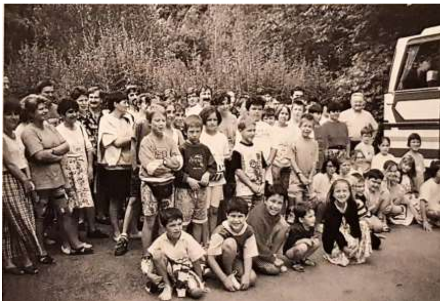
Un exemple de politique d'action sanitaire et sociale : l'organisation de colonies de vacances